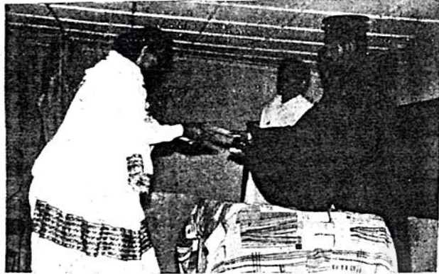
የደብረ አሚን ተክለ ሃይማኖት አስተዳዳሪ የምስክር ወረቀት ሲሰጡ

ቋረጭ ዘመቻውን በማካሄድ ላይ መሆናቸውን ጠይቀን ተረድተናል። ስለዚህ ለሌሎችም መንፈሳውያን ግንብራት መልካም ምሳሌ ሆነዋል እንላለን። በመገናኛ የተገለጠውንና ኅላ ብሎ የታየውን ለመናገር ያህል የደብረ አሚን መንፈሳውያን ወጣቶችን ምሳሌ አድርገን ለመጠቀም ሞክርን እንጂ በአቅጣቸው መጠን እያስተማሩ ለብዙ ግይግን የአውቀት ብርሃን የፈነጠቀ ብዙ መንፈሳውያን ወጣቶች እንዳሉ እናው