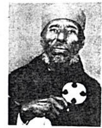
የሐመረ ሩኅ ኪዳነ ምሕረት አስተዳዳሪ

ቤተ ክርስቲያን በልማት በኩል የምታደርገው ፍረት እንዲሁ በልማቱ ሳይሆን ለመጀመሪያ ሰው “በፊትህ መዝ እንጅ ራህን ብላ የሚለውን አምላካዊ ትእዛዝ በመከተል ነው።” በዚህ መሠረት እነ ቅዱስ ጳውሎስ ቀን ወንጌልን በማስተማር ሌሊት ድንኳንን በመስፋት ጊዜያቸውን ሲጠቀሙ በት ከመኖራቸውም በላይ የወንጌልንም ብርሃን በመላው ዓለም ለማስራጨት ችለዋል። ቤተ ክርስቲያን በዚህ ብቻ ሳትወሰን በከብት ርቢም በኩል ከፍተኛ ድርሻ እንዳላት ቅዱስ ጳውሎስ እንዲሁ ሲል ያስረዳል “ወይንን ተክሉ ፍሬውን የማይበላ ማን ነው? መንጋውንስ እየጠበቀ ወተተን የማይጠጣ ማን ነው? ነኝ ቆር. 9: 7” ይህንንም መሠረት በማድረግ በሐመረ ሩኅ ኪዳነ ምሕረት የተጀመረው የከብት ርቢ እንዴት እንደ ተጀመረ የሐመረ ሩኅ ኪዳነ ምሕረት ቤተ ክርስቲያንን አስተዳዳሪና የሰበካ ጉባኤውን ሊቀ መንበር መምህር ፍሥሐ ቡሩክን እነጋግረናል።